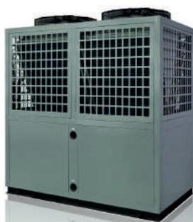
Altek Heat 40-92