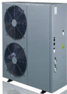
Altek Heat 19-26