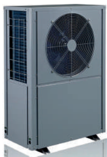
Altek Heat 11